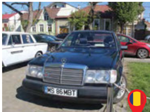
50 Iordachita Koradin/ RO Beres Rozalia/ RO Mercedes Benz W124 200 / 1986