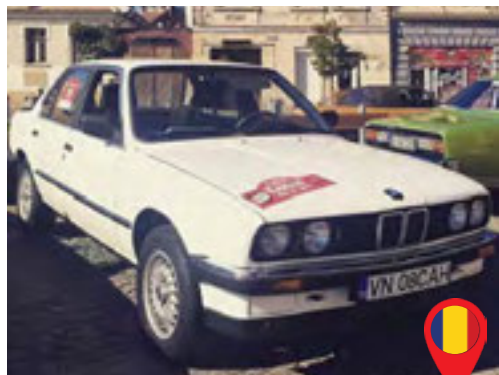
54 Camil Aliman/ RO Alina Aliman/ RO BMW E30, 318i / 1987