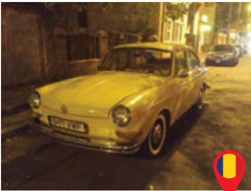
23 Adrian Dinca/ RO Ionut Liviu Trocea/ RO Volkswagen Fastback (Type 3) / 1971