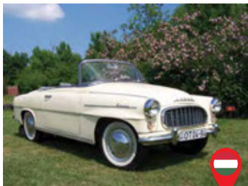
03 Varga András/ HU Sódárné Zsíros Ilona/ HU Skoda Felicia / 1960