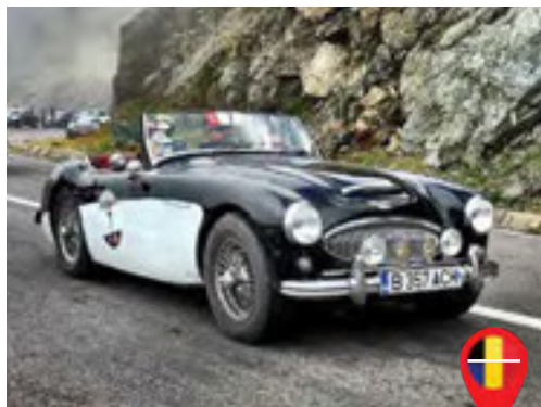
06 Hiver Cristian/ BE Hiver Aurelia/ RO Austin Healey 3000 MKII BT7 / 1961