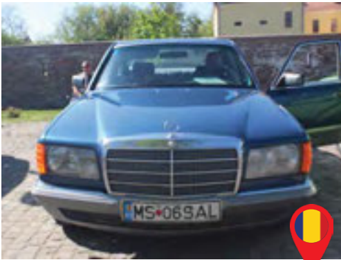
47 Sanmartinean Vasile Ioan/ RO Sanmartinean Violeta/ RO Mercedes s sel / 1985