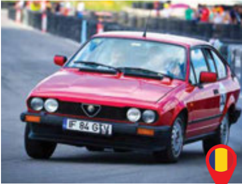
43 Dumitroae Mihai/ RO Dumitroae Viorica/ RO Alfa Romeo GTV / 1984