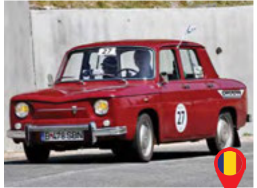
20 Popescu Mihai/ RO Popescu Georgia/ RO DACIA 1100 / 1970