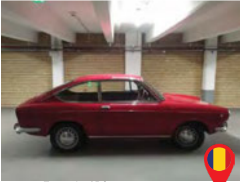
21 Turcan Ion/ RO Stelian Tipa/ RO FIAT 850 SPORT / 1970