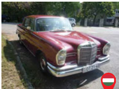
05 Kiss Tamás/ HU Szamosi László/ HU Mercedes W111 220S / 1965