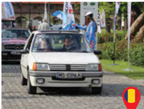
53 Gorea Adrian/ RO Gorea Agnes/ RO Peugeot 205 XS / 1987