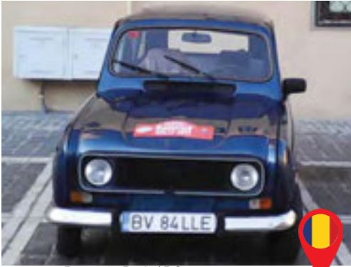
45 Puscariu Radu/ RO Puscariu Lucia/ RO Renault 4 TL / 1985